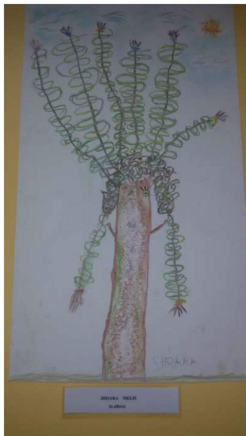
JHOARA MELB In allura